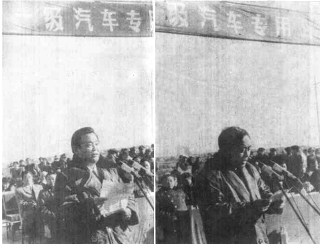
省交通厅厅长朱正昌在通车典礼上讲话。

同志们，建市十几年来，我市经济建设和各项事业蓬勃发展，取得了巨大成就，公路建设事业也有长足发展，已跻身于全省先进行列。但经济发展的新形势给我们的公路建设事业提出了更高、更新的要求，希望公路交通部门和各级、各单位，继续发扬艰苦创业的工作作风和团结协作的敬业精神，努力搞好公路建设和管理，同心同德，团结奋斗，把我市的公路建设提高到一个新水平，为加快实施黄河三角洲开发跨世纪工程做出更大的贡献！